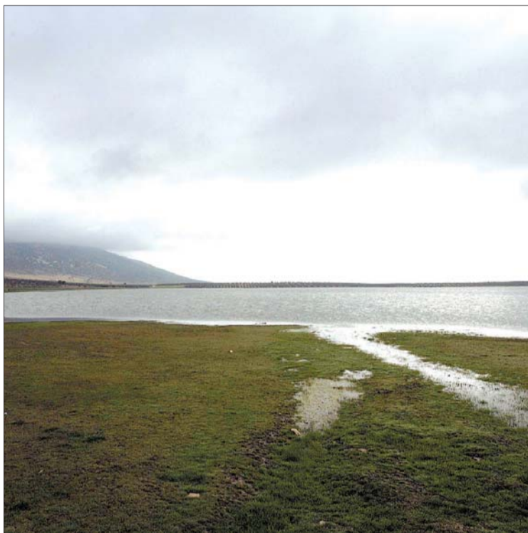
MAÑANA SE CELEBRA EL DÍA MUNDIAL de los Humedales.

El Inventario Nacional de Zonas Húmedas cuenta actualmente con casi 1.400 espacios húmedos, con una superficie mayor a 0,5 hectáreas, exceptuando ríos, cursos de agua y embalses. Howell hizo estas declaraciones en el marco de la firma del convenio de colaboración entre SEO/BirdLife y el Ayuntamiento de Pedro Muñoz (Ciudad Real) para establecer las bases de